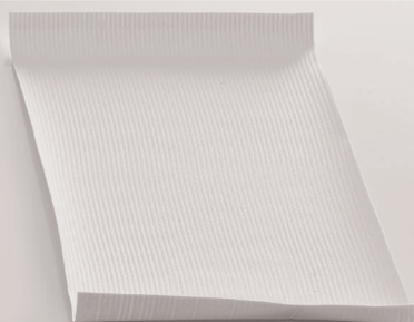
Fassadenanstrich mit MULTIRENOV XT

ELASTISCH UND WIDERSTANDS- FÄHIG, REISS NICHT !