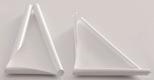
Fassadenanstrich mit Wettbewerbsprodukt